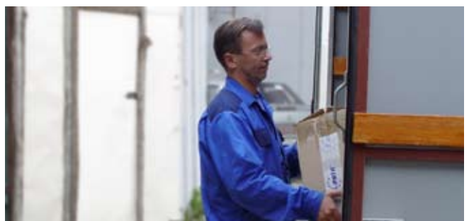
Партия проверенного товара готова отправиться к клиентам.

Будьте уверены, Техцентр компании “Рута”, как надёжный и верный друг, всегда рядом и готов прийти Вам на помощь!