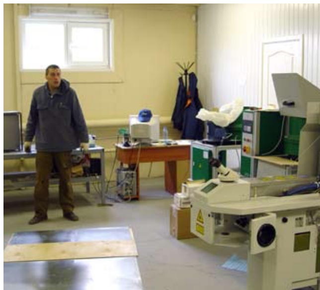
Хозяйский подход – во всём!

Кроме того, в настоящее время претворяется в действие программа реорганизации Центра, которая положит начало развитию целой сети региональных сервисных отделов. А это означает, что сотням клиентов в регионах, удаленных от центрального офиса Техцентра по первому требованию будет предоставлен качественный ремонт и послепродажное сопровождение их оборудования.