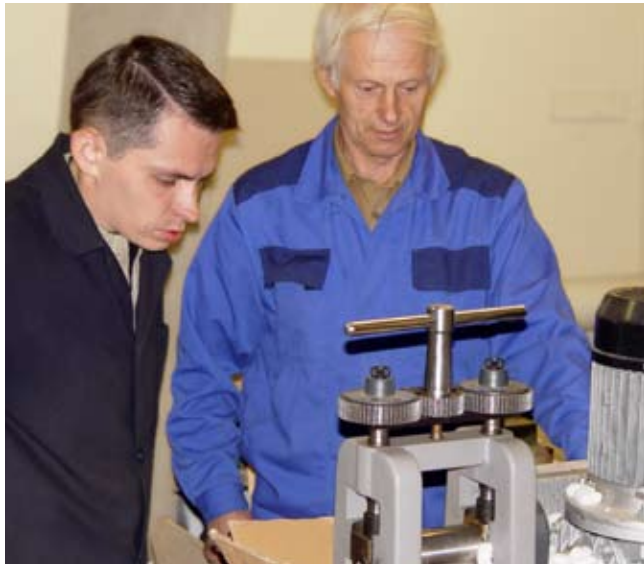
Проверка новой партии.

ляющим своим клиентам весь комплекс гарантийного и послегарантийного ремонта. Техцентр функционирует в специально оборудованном помещении площадью 180 квадратных метров. Свыше десятка квалифицированных инженеров проводят установку и обслуживание любого оборудования, задействованного в производстве ювелирных изделий.