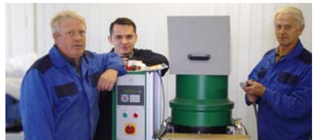
Оборудование проверено. Будет работать долго!